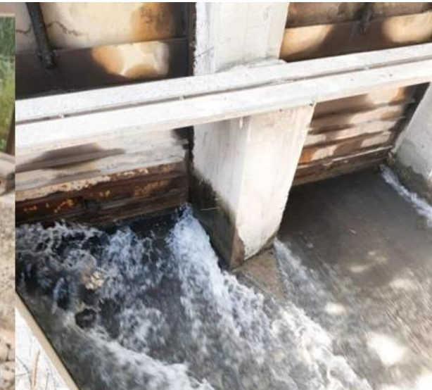
Foto 1. Canal San Miguel.